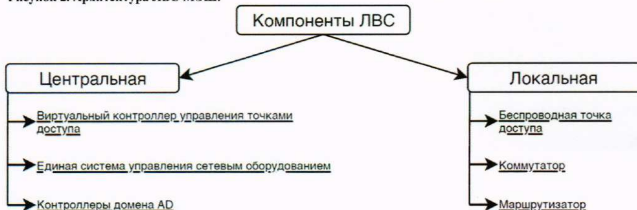
Рисунок 2. Архитектура ЛВС МЭШ.

6.6.1.3. Активное сетевое оборудование локальной компоненты должно обеспечивать подключение ТД, ИП, элементов СВН здания ОО (IP-видеокамер) и другого оборудования конечных пользователей, оснащенного сетевым интерфейсом стандарта Ethernet, к центральной компоненте ЛВС для доступа к сервисам МЭШ.