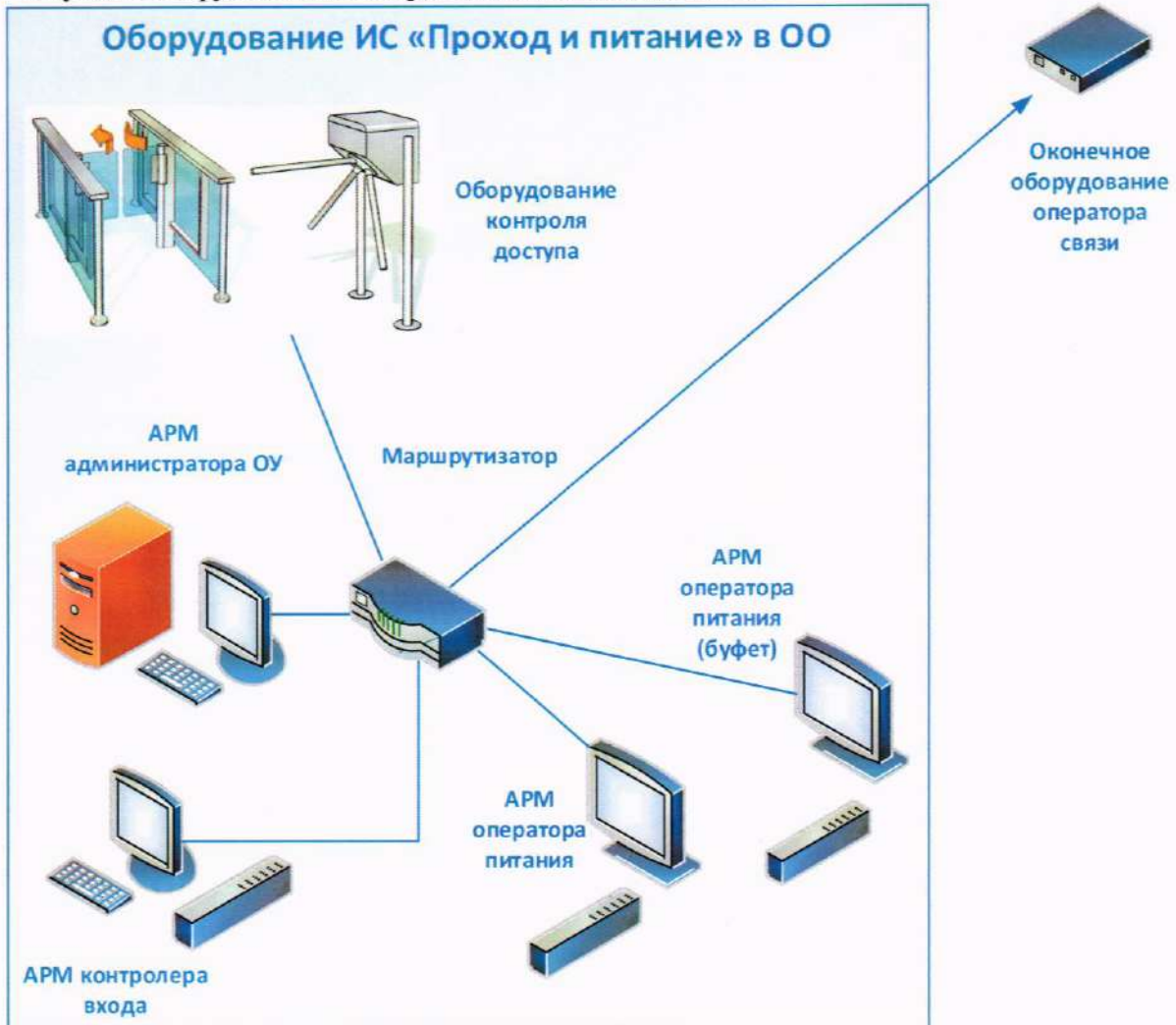
Рисунок 5. Оборудование ИС «Проход и питание» в здании ОО.

6.9.1.2. В рамках работ по оснащению зданий ОО оборудованием ИС «ПП» должна быть разработана рабочая документация для каждого здания ОО.